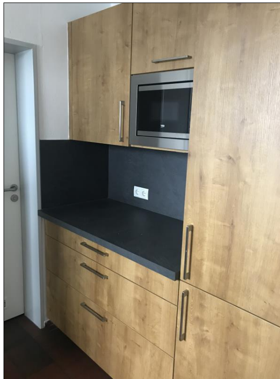
Küche im EG