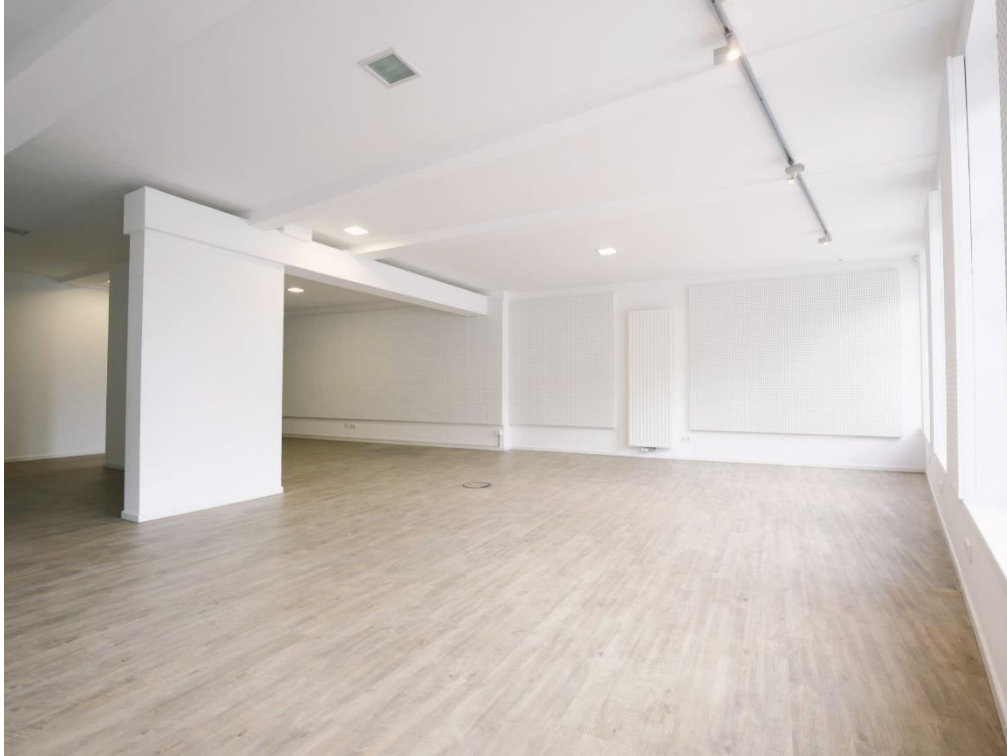
Großer gestaltbarer Büroraum