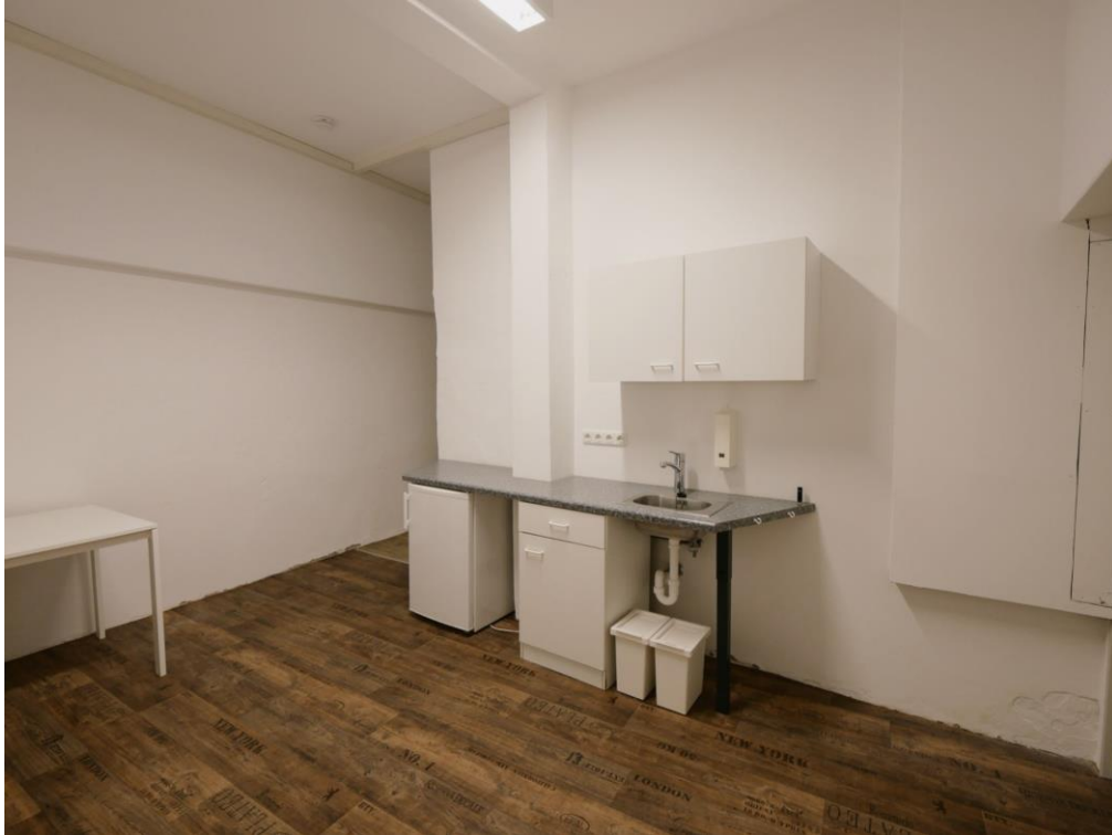
Teeküche / Sozialraum