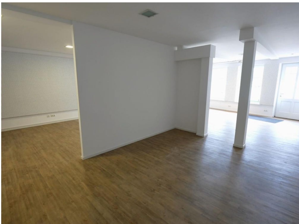
Moderne Rauntrennung Asbjørn Bracht Immobilien