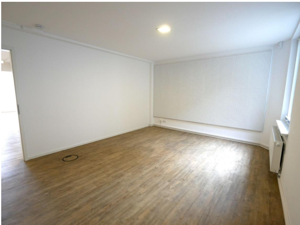
Separater Raum zum Innenhof gelegen Asbjørn Bracht Immobilien